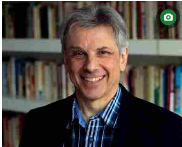
- RIPRODUZIONE RISERVATA